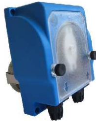
OPEN CASE IPS6