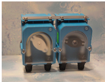
IPS3 double (Det+Rinse)